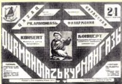
1936 жылдың 24 ақпанында Құрманғазы шығармашылығына арналған бірінші концерттің афишасы